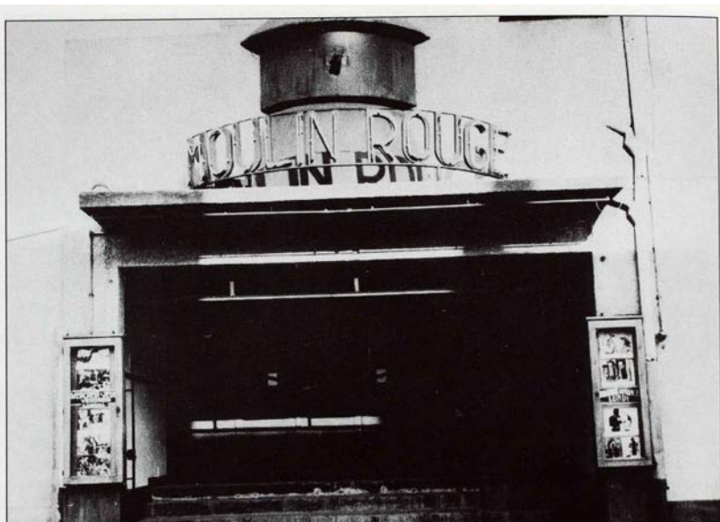
Le rideau noir est tombé : les sept cinémas existant à Drancy dans les années 1960 ont tous disparu. Le Moulin Rouge, aujourd'hui remplacé par une quincaillerie, était situé rue Charles Gide.

Mais un esprit provinciale est à préserver à tout prix, face au Grand Paris qui à force de grandir finit par être obèse et ne cesse d'élargir de cran en cran sa ceinture. Le début de la vie de ville de Drancy est secondaire. Résidence secondaire pour les riches parisiens qui viennent chercher l'air pur des campagnes le temps d'un week-end. Les Parisiens envhissent Drancy au point de se croire chez eux et Drancy se verra affublée de surnoms tels que le village parisien , Paris campagne , ou même l'avenir parisien .