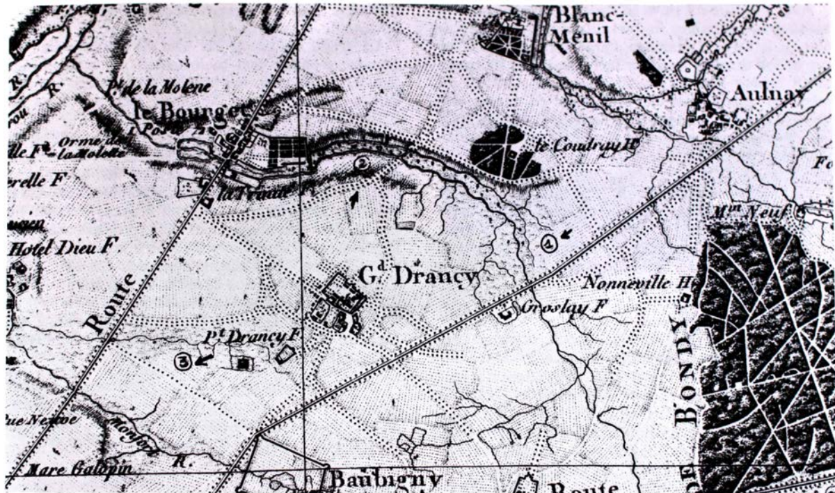
23 Marais protecteurs et nourriciers.

Les hommes préhystériques, ne s'installeront que tardivement, et la raison se trouve en étudiant le caractère du père géologique du territoire : un père protecteur et nourricier à condition de ne pas se laisser engloutir par le caractère débordant de ce dernier. Le marécage, donnera un caractère flottant à la ville. Présence d'une forêt séculaire. Petit à petit les seuls êtres vivants pouvant s'adapter seront les moutons, pattes dans l'eau attrapant les quelques brins d'herbe émergés.